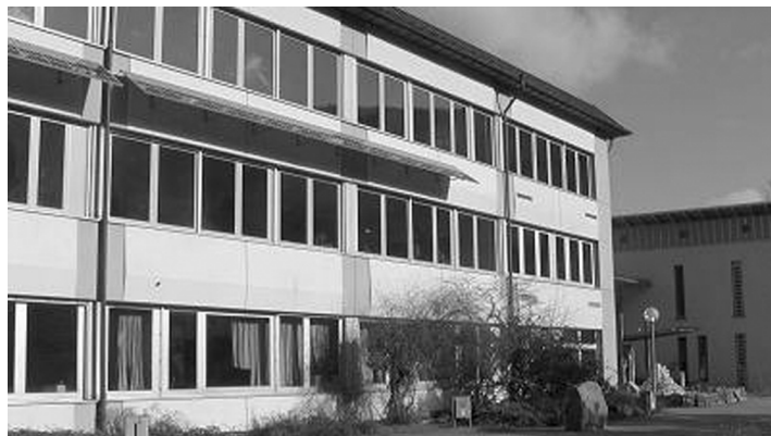
Regionale Schule Lambrecht

Der CDU Ortsverband Weidenthal begrüßt die Einrichtung eines Ganztagsangebotes an der Regionalen Schule Lambrecht. Mit Hilfe eines auf die Schüler zugeschnittenen pädagogischen Angebotes werden diese auch nachmittags in der Schule betreut. Dieses Angebot kann auch von Weidenthaler Schülern genutzt werden.